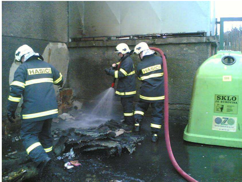
(Zásah JSDH Ludgeřovice, 2. března 2007, Markvartovická ul.)