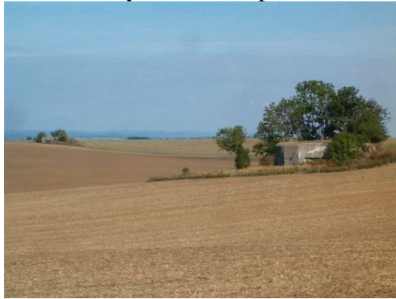
Pěchotní srub s překážkami v roce 1938