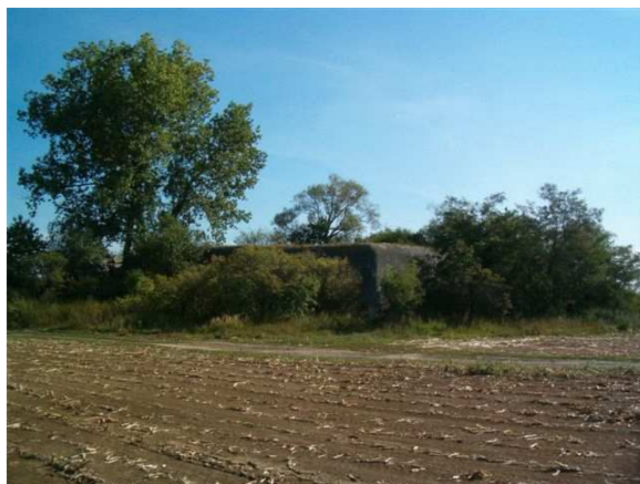
OP-S 12 „na rytířském“, v pozadí OP-S 13