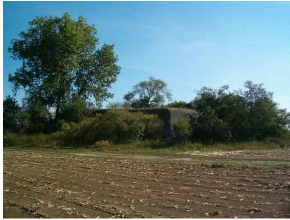
OP-S 12 „na rytířském“, v pozadí OP-S 13