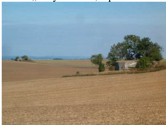
Pěchotní srub s překážkami v roce 1938