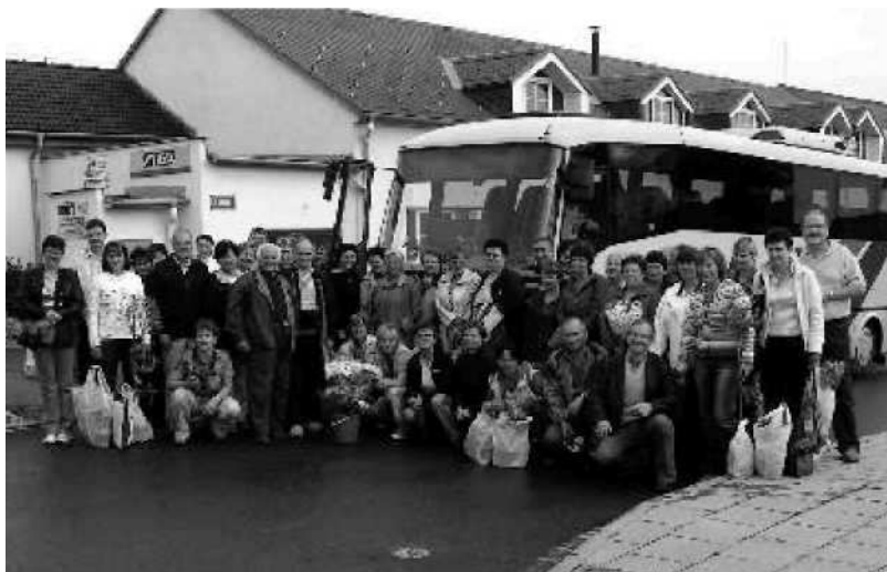
Výlet do Polska