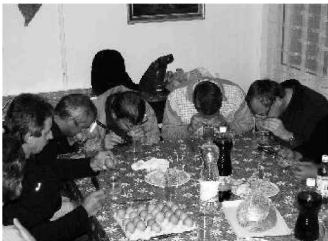
Vyfukování a smažení vajec

O Country večeru určitě mnozí z Vás taky něco vědí, protože si v našem areálu poslechli a zatančili u skladeb skupiny Zálesáci, která u nás už s úspěchem hostovala i v minulých letech. Je to vždy večer určený pro všechny generace a hlavně pro všechny milovníky tohoto žánru. I klobouky na hlavách přítomných se nám pomalu začínají množit.