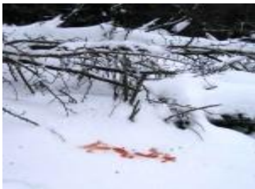
- barva (krev) po poranění končetin zvěře.

Nelehká situace zvěře ještě více zavazuje naše myslivce v Hati k nutnému přikrmování zvěře. Přes obtížnou cestu závějeji se často vydávají ke krmelcům s kvalitním krmivem na zádech. Hodně nepříjemný je již zmíněný ledový škraloup. Zvěř se do něj boří a může se o led vážně poranit. Předějit tomu prakticky nelze. Myslivci proto zatím s nadějí čekají až led roztaje a podmínky se zlepší. Současné počasí a zasněžená příroda lákají ven lidi, kteří často na procházku berou i psy. Pokud se chovají neukázněně a nechají psy volně běhat, zvěř pak klid nemá a je ve velkém ohrožení. Občané by si toto měli uvědomit, a hlavně nyní dopřát zvěři trochu více klidu. A navíc - podle zákona o myslivosti a zákona o lesích není možno nechat psa volně pobíhat v přírodě. Snažme se abychom pro naši zvěř nebyli ještě větší nepřítel, než sníh a krutý mráz.