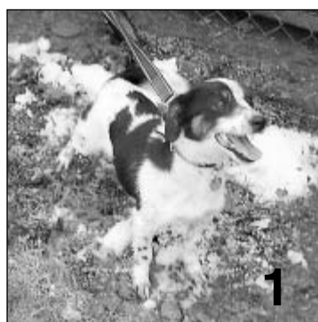
Snímek č. 1

V útulku pro psy v Hlučíně, v areálu TS Hlučín, s.r.o. na ul. Markvartovické se v současné době nachází tito psi a čekají na nové pány. Tel. č. 595 043 591