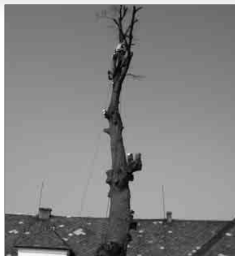
Kácení lípy u hospody U Hoňků