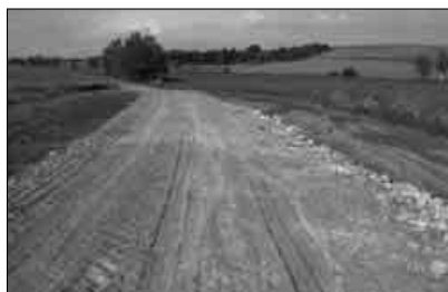
Stavba cyklostezky Svoboda-Kobeřice