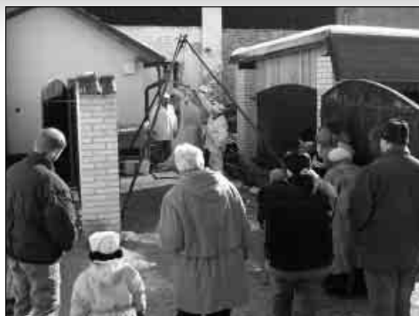
Obecní zabíjačka - březen 2004

Prvního května se stala Česká republika spolu s dalšími devíti zeměmi členy Evropské unie. Dřívější referendum potvrdilo vůli našich občanů být členy společenství států Evropy a podřídit se jejím pravidlům. Řada obyvatel naší země toto připojení vítala, řada se k celé situaci stavěla skepticky. Teprve historie ukáže správnost či pochybnost tohoto kroku. Fakt je, že od tohoto data mají občané členských států Unie možnost svobodně a bez komplikací překračovat hranice společenství. Odpadnou rovněž cla a změní se trh s pracovními příležitostmi. Teprve můj následovník bude moci posoudit, zda prvomájový krok byl krokem šťastným. Pro mladou generaci se otevřely hranice poznání i hranice mezi zeměmi. Bude snazší cestování, odpadnou zdlouhavé formality na celnicích.