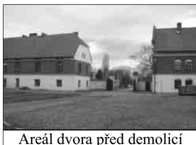
Areál dvora před demolicí