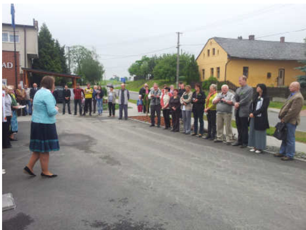
Příjezd hodnotitelské komise k Obecnímu domu