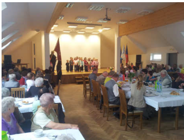
Prezentace obce Rohov