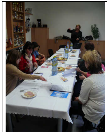
II. setkání pracovní skupiny 15.11.2013-zasedací místnost OÚ

Zpracoval Institut komunitního rozvoje Ostrava